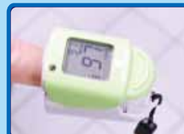
パルスオキシメーター

0.1μmのコロナウイルスだけでなく、更に1/6の0.0146μmまで除去出来る能力の装置を各更衣室、観覧席に設置しております。