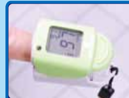
パルスオキシメーター

0.1μmのコロナウイルスだけでなく、更に1/6の0.0146μmまで除去出来る能力の装置を各更衣室、観覧席に設置しております。