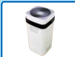
最新型空間除菌装置

当クラブでは店内やバスの消毒の他に、各更衣室、観覧席に最新型空間除菌装置を設置し、スタッフの出動時には体調、体温チェックの他に血中酸素飽和度を測定し、お客様が安心してご来店いただけるように努めております。